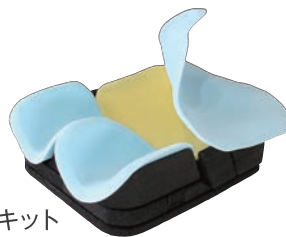
パディングキット