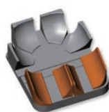
ウインドスウェプト