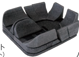
構造キット (フラットベース&インサート)