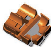
骨盤回旋左右非対称