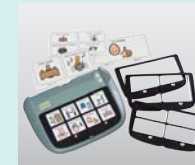
コミュニケーションエイド スーパートーカー