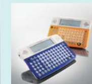
携帯用会話補助装置 ボイスキャリー ベチャラ