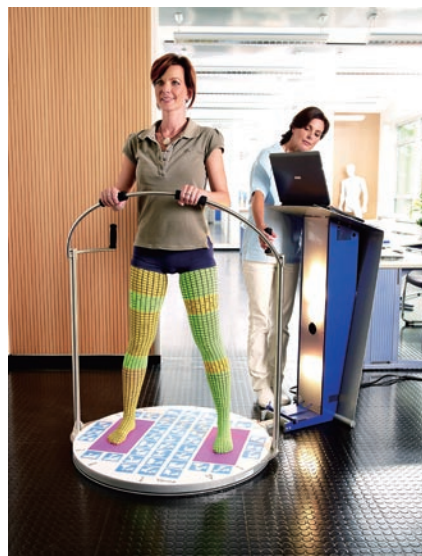
3D採寸テクノロジー

専用機が回転し、専用カメラを通じ対象者のボリュームと周径、長さをデジタル採寸し、その結果がコンピューター上に3次元モデルとして表示されます。