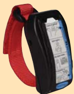
トークトラックプラスウィズレベル