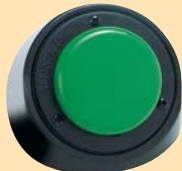
ステップバイステップウィズレベル