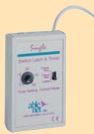
スイッチラッチアンドタイマー