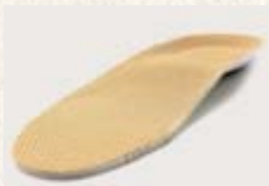
カップインソール付