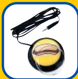
スナップスイッチキャップ BDアダプター