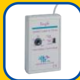
スイッチラッチアンドタイマー (シングル) パワーリンク2